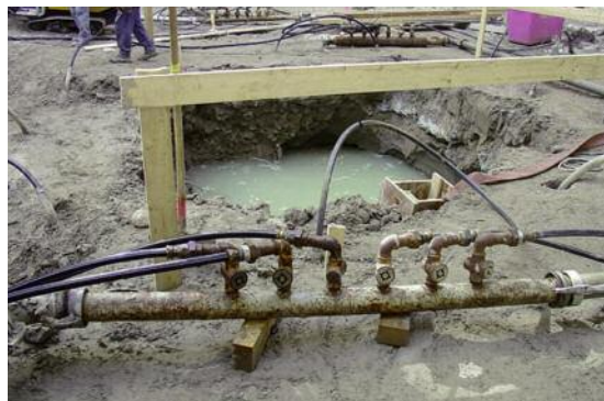
Wellpoint-Montage für Liftgrube.