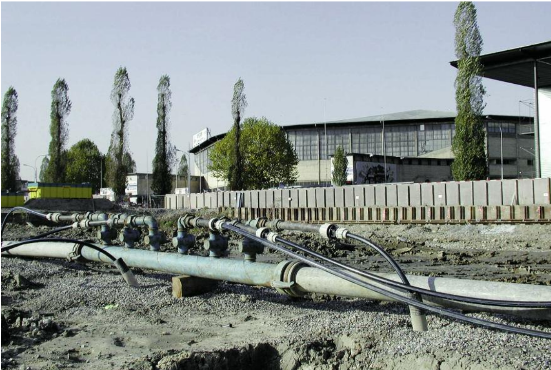
Überbauung vis-à-vis Hallenstadion Zürich; Saugleitung der Wellpoint-Anlage.