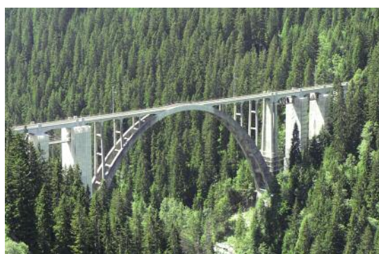
oben: Brückensanierung Hurden