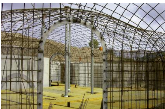
Geschweisste Armierung für Spritzbetonhaus